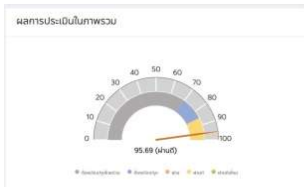
กราฟผลการประเมินของหน่วยงานมาจากระบบ ITAS

ผลการประเมินคุณธรรมและความโปร่งใสในการดำเนินงานของเทศบาลตำบลดอนประดู่ โดยภาพรวมได้คะแนนเฉลี่ยร้อยละ ๙๕.๖๙ (ผ่านดี) ซึ่งถือว่ามีความคุณธรรมและความโปร่งใสในการดำเนินงานระดับ ผ่านดี เมื่อพิจารณาตามตัวชี้วัดพบว่า ตัวชี้วัดการปฏิบัติหน้าที่ ได้คะแนนเฉลี่ยร้อยละ ๑๐๐.๐๐ ตัวชี้วัดการใช้งบประมาณ ได้คะแนนเฉลี่ยร้อยละ ๑๐๐.๐๐ ตัวชี้วัดการใช้อำนาจ ได้คะแนนเฉลี่ยร้อยละ ๑๐๐.๐๐ ตัวชี้วัดการใช้ทรัพย์สินของทางราชการ ได้คะแนนเฉลี่ยร้อยละ ๑๐๐.๐๐ ตัวชี้วัดการแก้ไขปัญหาการทุจริต ได้คะแนนเฉลี่ยร้อยละ ๑๐๐.๐๐ ตัวชี้วัดคุณภาพการดำเนินงาน ได้คะแนนเฉลี่ยร้อยละ ๙๘.๕๘ ตัวชี้วัดประสิทธิภาพการสื่อสาร ได้คะแนน เฉลี่ยร้อยละ ๙๗.๐๓ ตัวชี้วัดการปรับปรุงการทำงาน ได้คะแนนเฉลี่ยร้อยละ ๙๖.๒๘ ตัวชี้วัดการเปิดเผยข้อมูล ได้คะแนนเฉลี่ยร้อยละ ๘๒.๕๐ และ ตัวชี้วัดการป้องกันการทุจริต ได้คะแนนเฉลี่ยร้อยละ ๑๐๐.๐๐